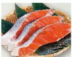
【魚耕】ロシア産ほか 紅鮭切身(甘口)(3切 1パック) 646円