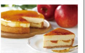
【ブールミッシュ】アントルメ・オ・シブースト(5号 1箱) 1,588円