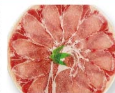
【デイリーミート】国産 豚ロースしゃぶしゃぶ用(250g 1パック) 648円