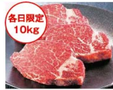
【柿安】国内産 黒毛和牛ヒレステーキ用(100g当たり) 1,280円