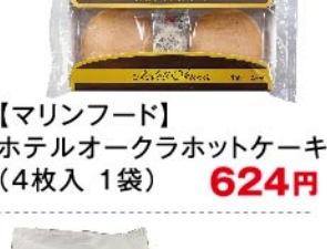
【マリンフード】ホテルオークラホットケーキ(4枚入 1袋) 624円