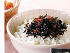
【太宰府えとや】梅の実ひじき(150g 1パック) 961円