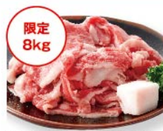
【肉匠もりやす】限定 8kg 国内産 黒毛和牛切り落とし(肩、モモ、バラ)(100g 当たり) 972円