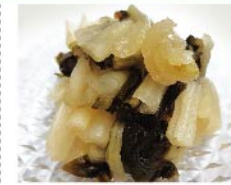
【知々夫屋】(石川漬物) しゃくしな漬(250g 1袋) 429円