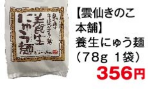
【雲仙きのこ本舗】養生にゆう麺(78g 1袋) 356円