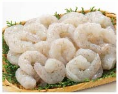
【魚耕】インド産ほか背わた取りむきえび(養殖)(230g 1パック) 594円