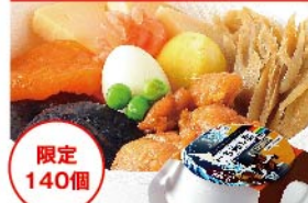
【おぎのや】限定 140個 峠の釜めし(1個) お一人さま6個まで 1,400円 ※正午から販売開始予定 ※交通状況により到着時間が遅れる場合がございます。