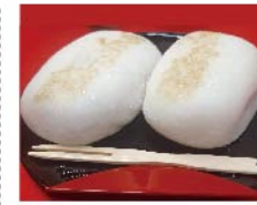
【知々夫屋】(水戸屋本店) ちぢ餅(2個入 1袋) 429円