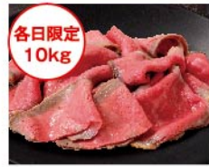
【肉匠もりやす】各日限定 10kg 国内産 黒毛和牛ローストビーフ 切り落とし(モモ)(100g 当たり) 951円