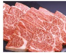
【柿安】国内産 黒毛和牛 ロース鉄板焼き用(100g当たり) 1,280円