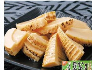
【マルイシ食品】いぶりたけのこ ハーフカット(1個) 918円