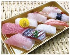
【魚耕】市場寿司[赤酢寿司](9貫 1折) 1,618円