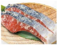
【浜作】宮城県産 銀鮭西京漬(2切 1パック) 599円