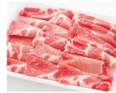
【デイリーミート】国産 豚肩ロース切り落とし(100g当たり) 248円