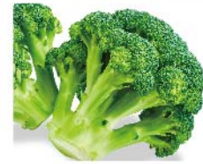
【ころくや】愛知県産ほか ブロccoli(1株) 162円