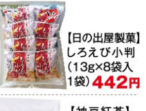
【日の出屋製菓】しろえび小判(13g×8袋入 1袋) 442円