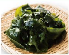
【浜作】宮城県産 わかめ(塩蔵)(140g 1袋) 538円