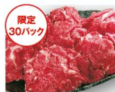
【柿安】国内産 黒毛和牛小間切れ(250g 1パック) 1,080円