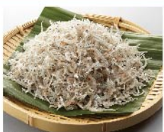
【浜作】国産ちりめん(70g 1盛) 626円