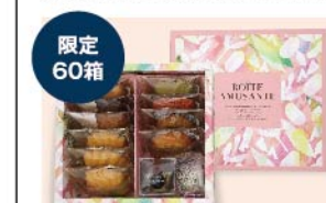
【ブールミッシュ】限定 60箱 お楽しみBOX(12個入 1箱) 1,296円

日本の本格的フランス菓子の草分け的存在として知られている「ブールミッシュ」。店主、吉田菊次郎がフランス・パリで研鑽した伝統的なフランス菓子を基本に、新しい創作菓子にも挑戦しています。