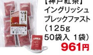
【神戸紅茶】イングリッシュブレックファスト(125g 50袋入 1袋) 961円