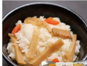
【笑美香】九州産竹の子混ぜご飯の素(130g 1袋) 440円