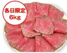
【肉匠もりやす】各日限定 6kg 国産牛ランプ ローストビーフ(100g 当たり) 1,026円