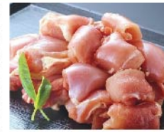
【デイリーミート】国産 若鶏モモ肉(100g当たり) 138円