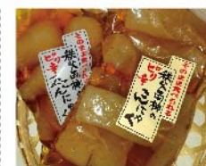
【知々夫屋】(ふるさと両神) ピリ辛こんにゃく(200g 1パック) 108円