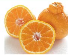
【ころくや】佐賀県産ほか 不知火(1パック) 646円