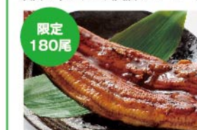
【魚耕】愛知県三河一色産 うなぎ長焼(約110g 1尾) お一人さま5尾まで 1,944円

※3月30日(日)に西武所沢S.C.地下1階・1階=西武食品館 対象売場で1回1,000円(税・配送料除く)以上のお買いあげが対象となります。 ※一部除外となる売場・商品がございます。 ※クラブ・オンカード セゾン以外のクレジット決済、バーコード決済はポイント加算対象外となります。