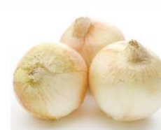
【ころくや】長崎県産ほか 新玉ねぎ(1袋) 108円