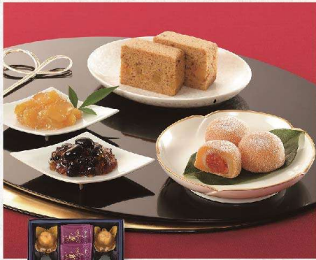
【宗家 源 吉兆庵】季節の果泉 (栗満つ×2、黒凧×2、栗かすてら ×4、柿甘珠×2 1箱) 3,240円 賞味期限：製造日から常温30日/店頭お渡し可/常温配送