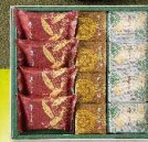
【菓匠 清閑院】栗しぐれ詰合せ (栗しぐれ×4、栗ころも×4、 華ときわ×4 1箱) 3,240円 賞味期限：製造日から常温45日/店頭お渡し可/常温配送